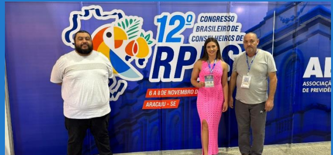
12º Congresso Brasileiro de Conselheiros

O ano de 2024 foi marcado por diversos desafios e transformações no mercado financeiro, tanto no Brasil quanto no exterior. No Brasil a inflação foi um dos principais desafios, com o IPCA fechando o ano em 4,83%, acima do teto da meta de 4,5%. Isso levou o Banco Central a manter a Selic em 12,25% e projetar novas altas para 2025. O principal índice da bolsa brasileira, o Ibovespa, apresentou uma queda de 10,8% ao longo do ano. A desconfiança dos investidores com o cenário fiscal e a alta dos juros contribuíram para essa queda. O dólar teve uma valorização significativa de 27,4% em relação ao real, atingindo um valor de R$ 6,21 no final do ano. Isso foi impulsionado por uma política monetária mais restritiva nos Estados Unidos e preocupações com a inflação no Brasil. Os mercados internacionais também enfrentaram desafios, com guerras na Europa e no Oriente Médio e incertezas econômicas globais. No entanto, houve momentos de alta, especialmente nas bolsas europeias, impulsionadas por um aumento no preço do petróleo