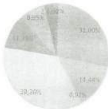
GRÁFICO 2: INVESTIMENTO EM RENDA FIXA POR INDEXADOR - ABRIL DE 2022. FONTE: OS AUTORES (2022).

Gráfico 2: investimento em renda fixa por indexador- Abril de 2022. Fonte: Os autores (2022).