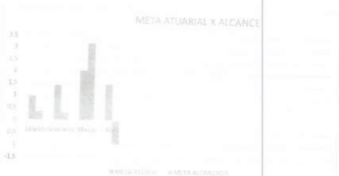
Gráfico 8: Comparação entre a meta atuarial e a meta alcançada.

Observou-se que a rentabilidade da carteira teve um percentual negativo de -0,97%. Sendo este concentrado na renda variável. Os ganhos na renda fixa não conseguiram superar a baixa da renda variável, deixando o TAIÓPREV abaixo da meta atuarial.