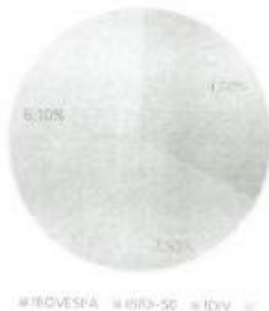
Gráfico 3: Investimentos em renda variável por indexador Abril de 2022

Abril foi um mês duro para os ativos de risco, com os mercados se ajustando a uma postura mais dura do Fed (Banco Central dos Estados Unidos) na luta contra a inflação. O Ibovespa caiu 10%, um pouco mais que as bolsas globais, que perderam 8%. O Real também se desvalorizou em relação ao Dólar, algo em torno de 5%.