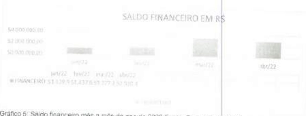
Gráfico 5: Saldo financeiro mês a mês do ano de 2022