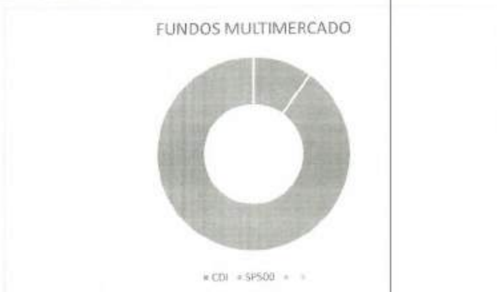
Gráfico 4: Investimentos em Fundos multimercado por indexador 1º Trimestre de 2022