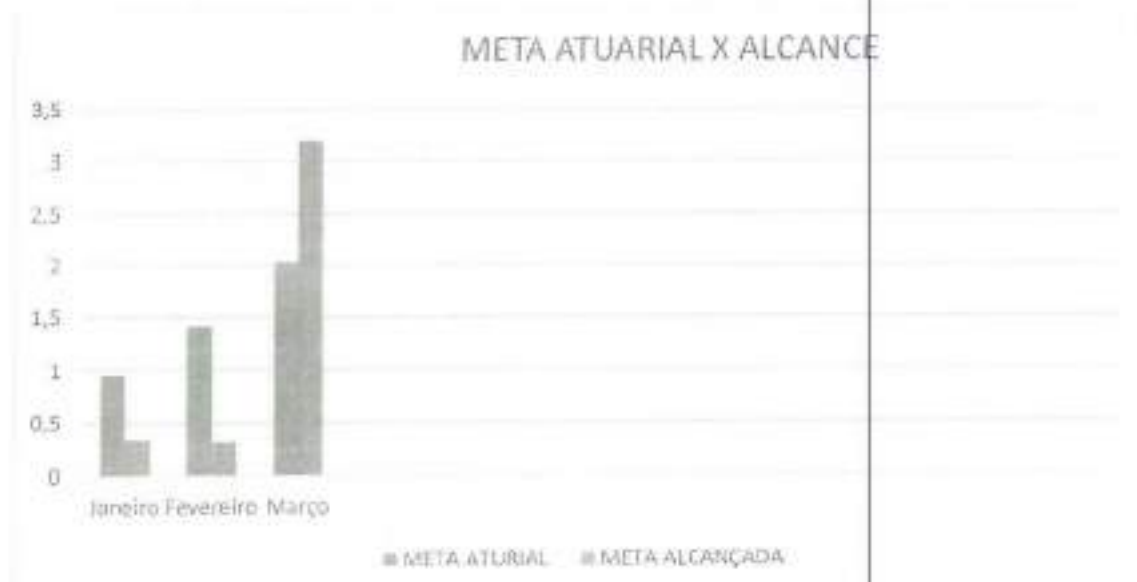
Gráfico 6: Comparação entre a meta atuarial e a meta alcançada

Observou-se que a rentabilidade da carteira teve um percentual positivo de 3,88% demonstrando uma sutil recuperação dos ganhos de investimento 1º trimestre de 2022, minimizando assim as perdas compradas com a meta atuarial do ano de 2021.