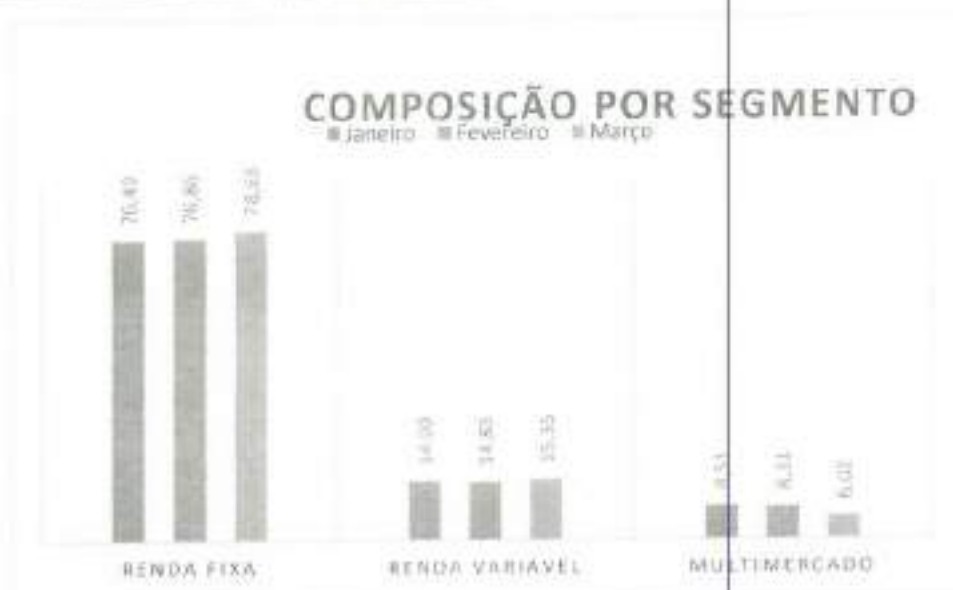
Gráfico 1: Composição da Carteira do TAIÓPREV por segmento em 1º trimestre de 2022.