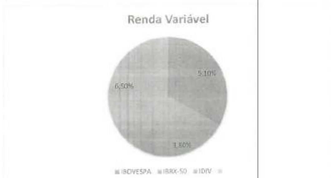
Gráfico 3: Investimentos em renda variável por indexador 1º Trimestre de 2022

O Brasil dos juros de dois dígitos produziu um primeiro trimestre de bons resultados para os investidores. Valeu para quem ficou na segurança da renda fixa e, mais ainda, para os que se encorajaram a permanecer no risco bolsa e em