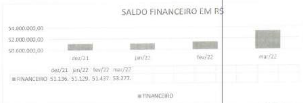
Gráfico 5: Saldo financeiro em Dezembro 2021 e os meses do 1º trimestre do ano de 2022.